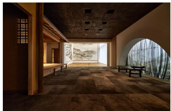
プレナス東京本社7階