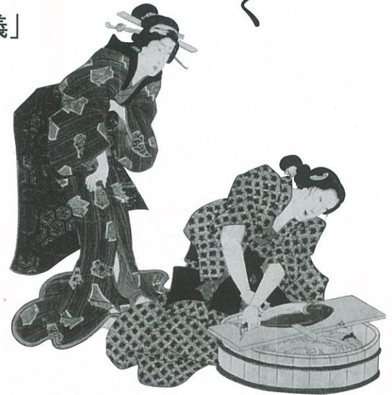
「十二月之内 卯月初時鳥」味の素食の文化センター所蔵